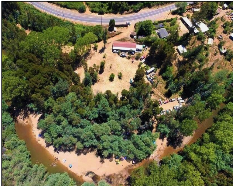
Figura 2. Vista aérea al camping “Los Queules”.